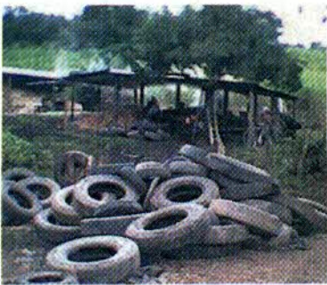
Producción Tradicional en la Zona de Taulabé, Comayagua

La Red COMAL, teniendo conciencia de esta realidad y con el propósito de contribuir en la reducción de la contaminación ambiental, está apoyando a algunas empresas asociativas campesinas, para que tengan acceso a nuevas tecnologías de producción de panela granulada orgánica. Estas acciones están fundamentadas en principios de respeto a la vida y la naturaleza.