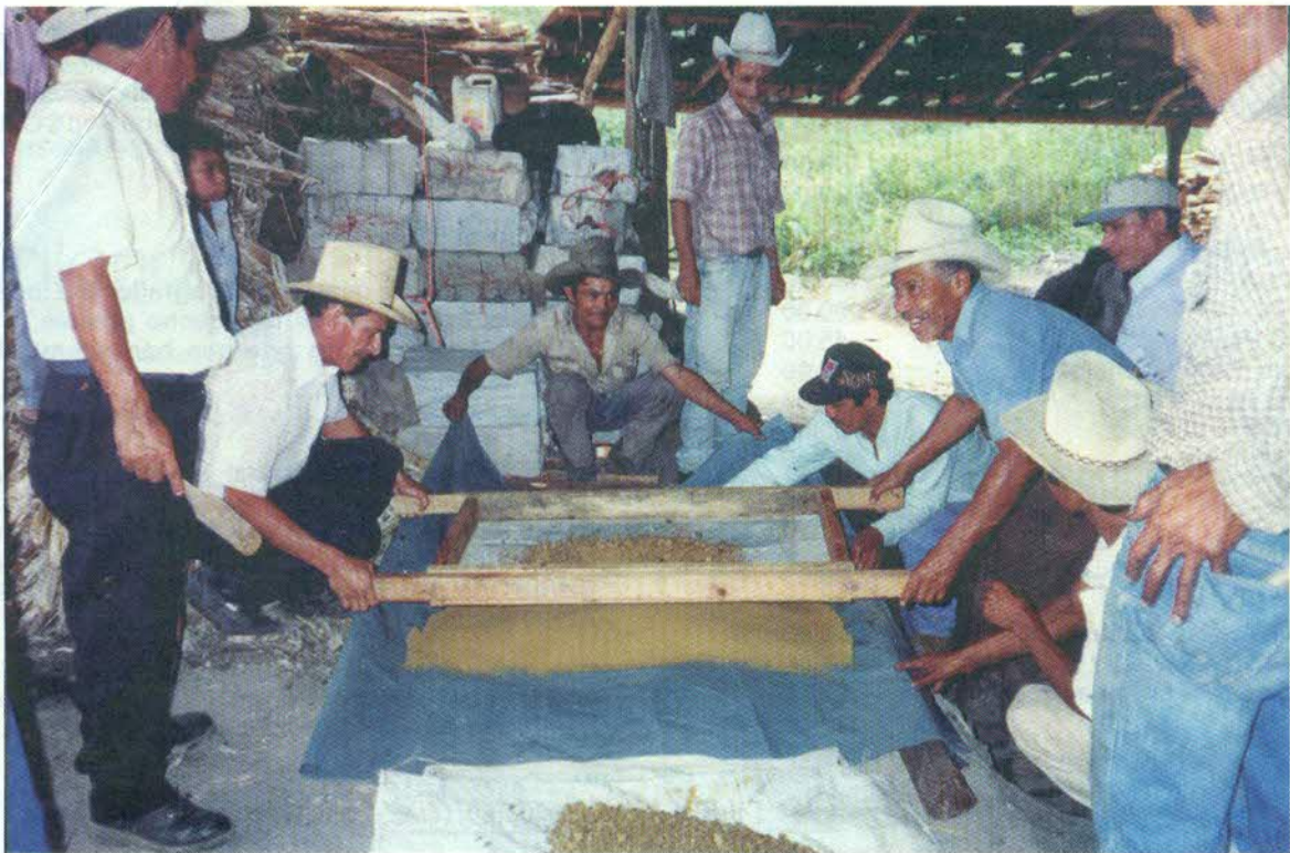
Campesinos organizados productores de caña de la zona de Taulabé, sonríen satisfechos, al comprobar con el fruto de su trabajo, el potencial innovador que poseen.

Este esfuerzo se hizo posible por el intercambio de experiencias técnicas que COMAL ha sostenido con productores de Panela Granulada de Maquita Cushunchic, organización fraterna de Ecuador, afiliada a la Red Latinoamericana de Comercialización Comunitaria, RELACC.